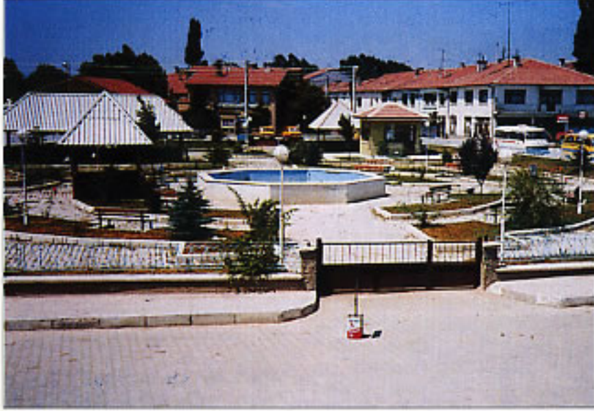
Dörtdivan merkezinden bir görüntü..

Saygıdeğer hemşehrilerim, bize vereceğiniz her türlü destek ile ilçemize ve insanımıza faydalı olacak hizmetleri yapacağımıza inanıyoruz. Çalışmalarımız esnasında yapmış olduğumuz kusurlarımızdan dolayı affımıza sığınırız.