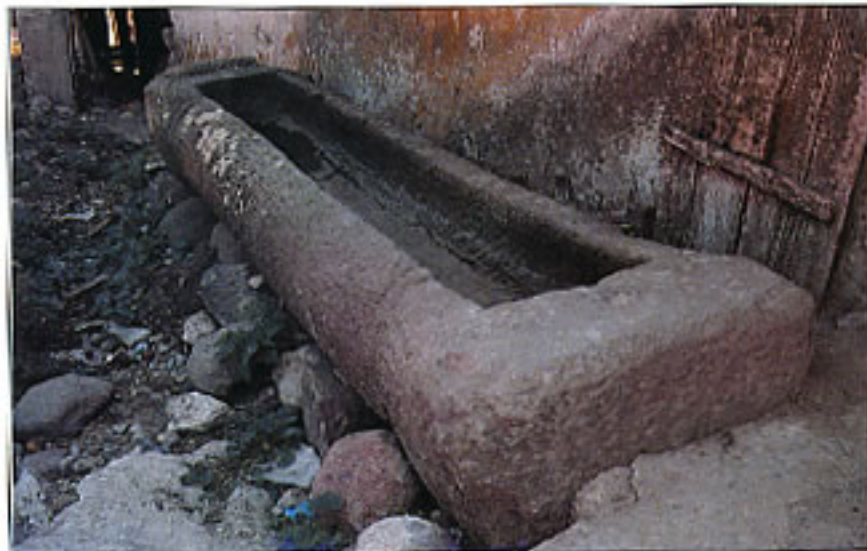
Köroğlu'nun atını suladığı rivayet edilen taş oluk.

yaşayan cins bir aygırın, cins bir kısırağa aştığını öğrenir. Bu kısıraftan doğan kır bir taya talip olur. Atlardan anlayan seyis, bu kır tayın ilerde çok cins bir at olacağını bilmektedir. Yusuf bu kır tayı, beraberinde Bolu'ya getirir. Fakat Bey o anda çirkin ve gösterişsiz olan bu tayı görünce, cıderi tepesine çıkar: Vay melun! Demek sen benimle alay ediyorsun. Ben seni şimdi ne yapayım? Her ne kadar zavallı seyis kendisini müdafaa etmek ister-