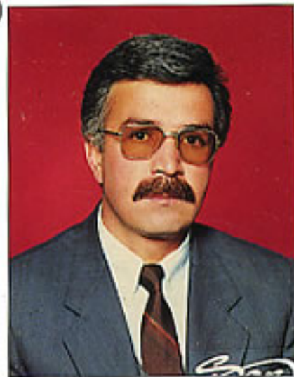
Hazırlayan: Recep ŞENGÜN

Bolu Bey'inin Deli Yusuf isminde bir seyisi vardı. Atlarıyla o ilgilenirdi. Deli Yusuf, atlardan çok iyi anlayan bir at bakıcısıydı. Çok konuşmazdı. Konuştuğunda her söylediği doğru çıkardı. İşini bilen yaman bir adamdı. Bir gün Bolu Beyi, seyisi Deli Yusuf'u çağırıp, kendisine cins bir at bulmasını emreder. Deli Yusuf Bolu Beyi'nin istediği cins atı bulabilmek için Bolu'nun doğusundaki illere seyahate çıkar. Seyis Deli Yusuf, nehir kıyısında