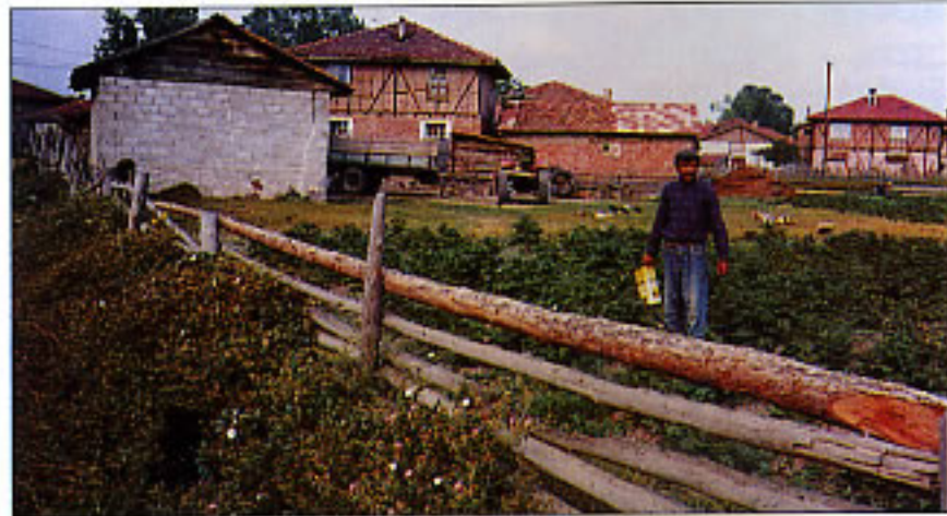
Patates tarımı yöremizin en büyük gelir kaynağı

TARIMI : Patates ılıman ve serin iklim bitkisidir, en iyi yetişebileceği yerler 1000 metre civarındaki yaylalardır. Patates her türlü toprakta yetişse de killi toprakları sever, hafif bünyeli (kumlu-tınlı), iyi drene olan, humusca zengin ve pH'sı 5-7 arasında olan topraklardan hoşlanır. Tuzluluğa orta derecede hassastır. Tarla bitkileri içersinde ağır gübresinden en fazla hoşlanan bitkidir. Ortalama 2000 kg/da. ürün alındığında, patates topraktan 10 kg N, 18 kg K 2 O ve 4 kg P 2 O 5 alır. Ortalama su tüketimi iklim ve toprak koşullarına bağlı olarak 400 ile 700 mm arasındadır. Gelişme sürelerine göre; erkenci çeşitler (65-90 gün), orta erkenci çeşitler (90-120 gün) ve geç çeşitler (120-150) olmak