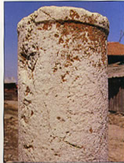
Köylerimizdeki tarihi eserlerden biri.